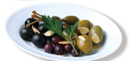
オリーブ マリネ Marinated Olives