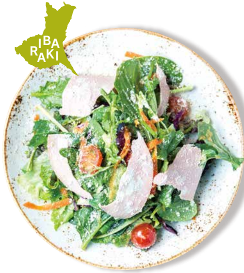
茨城県産野菜7種類以上の ナナイロサラダ