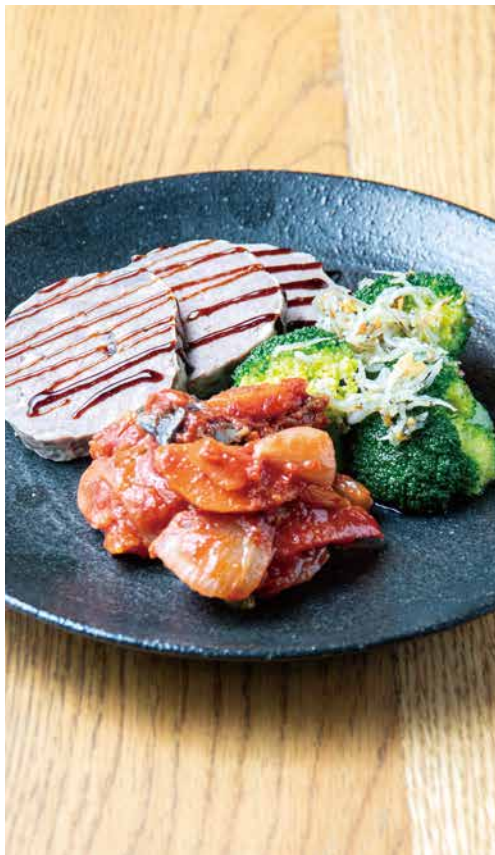
本日のイタリア前菜 3種盛り