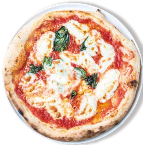
マルゲリータ 1430 Margherita トマトソース・バジル・モッツアレラ・グラナバダーノ