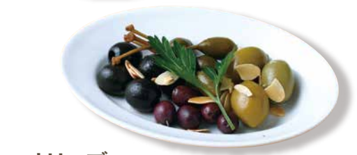
オリーブ マリネ Marinated Olives