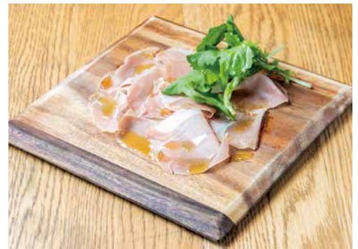
スロベニア産10ヶ月熟成 生ハム Raw Ham