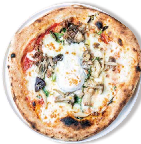
サルシッチャと茸、 半熟卵のビスマルク 白トリュフオイルをアクセントに Bismark サルシッチャ・キノコ・トマトソース・モッツアレラ 松の実・アーモンド・卵・グラナバダーノ・白トリュフオイル