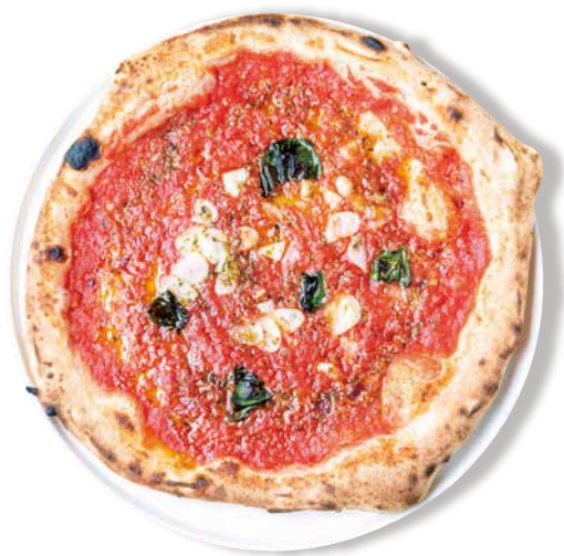
マリナーラ 1300 Marinara トマトソース・オレガノ・国産ニンニク・バジル グラナバダーノ