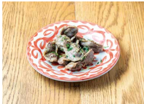
砂肝コンフィ 780 Chicken Gizzard Confit