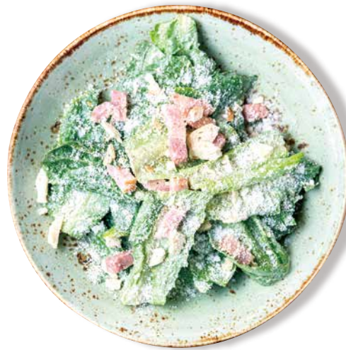
シーザーサラダ Caesar Salad