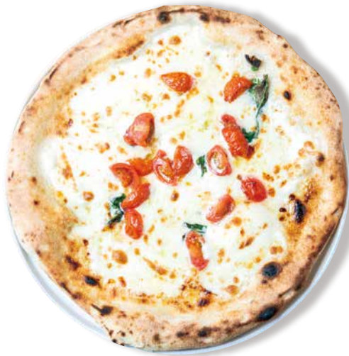
マルゲリータビアンカ 1540 Margherita Bianca バジル・モッツアレラ・ミニトマト・生クリーム グラナバダーノ