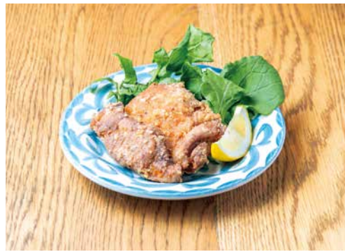
スパイシーチキンフリット 770 Spicy Fried Chicken