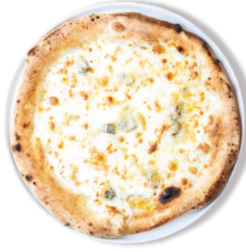
4種類チーズの クアトロフォルマッジ Quattro Formaggi モッツアレラ・マスカルポーネ・ゴルゴンゾーラ タレッジョ・グラナバダーノ お好みでハチミツをかけてどうぞ!