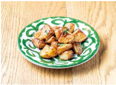
パタティーネ 530 Fried Potato