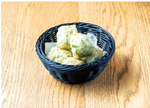
ナポリ名物料理 ゼツポレ 530 Zeppole