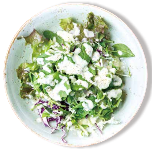
リーフサラダ Leaf Salad