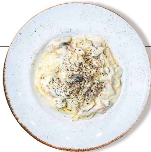
ベーコンと 3種きのこのカルボナーラ 1780 Bacon & Mushroom Carbonara