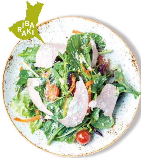
茨城県産野菜7種類以上の ナナイロサラダ