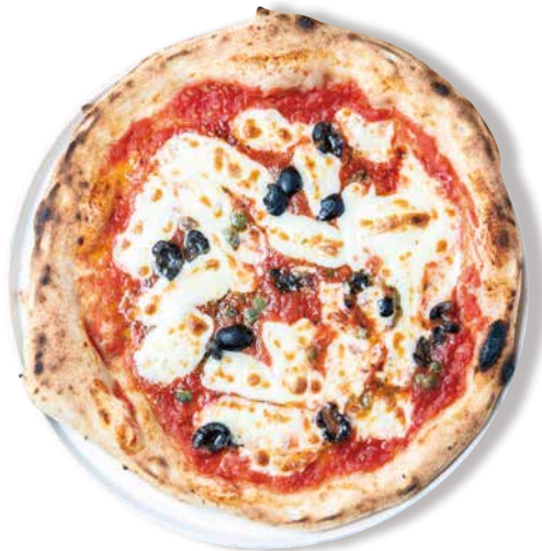
ロマーナ 1580 Romana トマトソース・オレガノ・モッツアレラ・アンチョビ オリーブ・ケッパー・グラナバダーノ