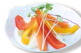
旬野菜の ピクルス Pickles