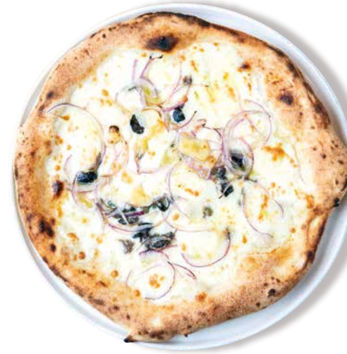
プリエーゼ 1630 Pugliese モッツアレラ・アンチョビ・ケッパー・オリーブ 国産ニンニク・赤玉ねぎ・グラナバダーノ