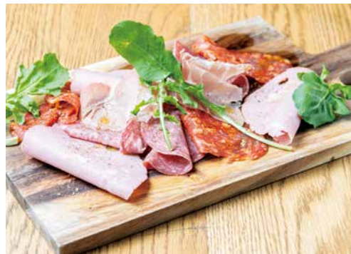
生ハム・サラミの 盛り合わせ