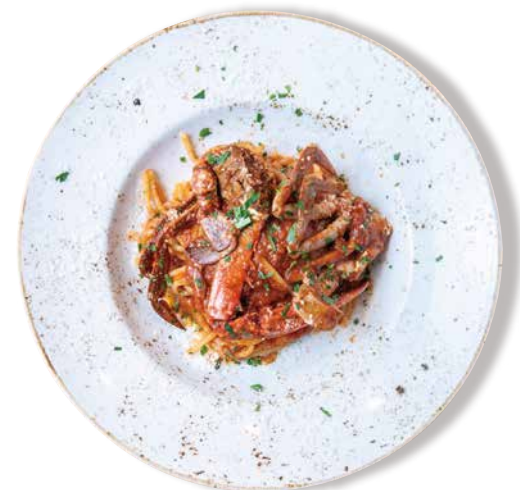
渡り蟹のトマトソース 生パスタ"フェットチーネ" Fettuccine with Blue Crabs & Tomato Sauce 1680