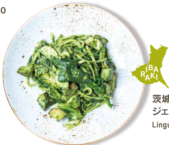
茨城県産バジル・大葉の ジェノベーゼ 生パスタ"リングイネ" Linguine with Green Shiso & Basil Sauce 1880