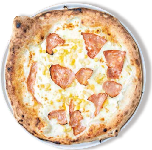
マイルス 1570 Mais マスカルポーネ・モッツアレラ・コーン モルタデラハム・グラナバダーノ