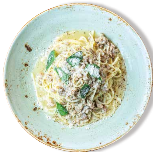
豚ひき肉と玉ねぎの 白ワイン煮込みソース ジェノバ風スパゲッティーニ Spaghettini with Braised Pork, Onion & White Wine 1520