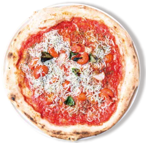
チチニエリ 1540 Whitebait Marinara トマトソース・オレガノ・バジル・国産ニンニク ミニトマト・蓋揚げしらす・グラナバダーノ