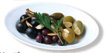
オリーブ マリネ Marinated Olives