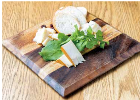
チーズ盛り合わせ Assorted Cheese