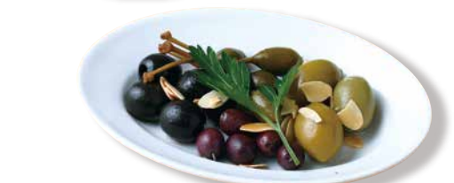
オリーブ マリネ Marinated Olives