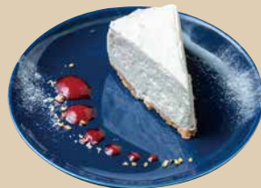
レアチーズケーキ No-Bake Cheese Cake 530 [税込580]

焼きたてのフォンダンショコラの中から チョコがとろ〜り バニラアイスと一緒にどうぞ!