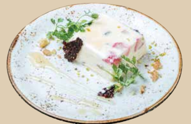
セミフレッド Semifreddo 500 [税込550]

濃厚なマスカルポーネチーズと コーヒーのエスプレッソが絶妙な イタリア定番のデザート