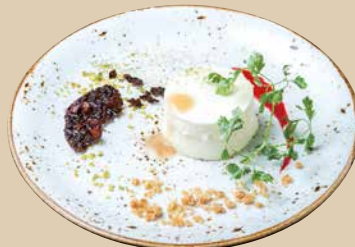
パンナコッタ Panna Cotta 450 [税込490]