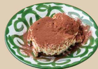
ティラミス Tiramisu 600 [税込660]

濃厚なマスカルポーネチーズと コーヒーのエスプレッソが絶妙な イタリア定番のデザート