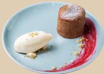
フォンダンショコラ バニラアイス添え Chocolate Fondant with Vanilla 620 [税込680]

焼きたてのフォンダンショコラの中から チョコがとろ〜り バニラアイスと一緒にどうぞ!